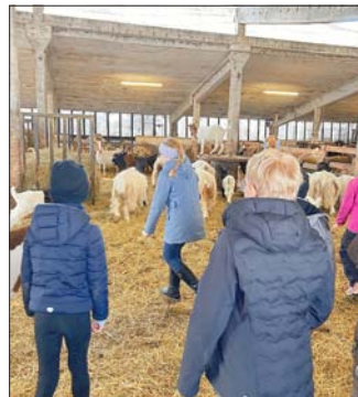
Im Ziegenstall der AGN Neunheilingen.