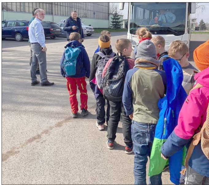
Mit dem Bus des Kinderfreundlichen Landkreises unterwegs.