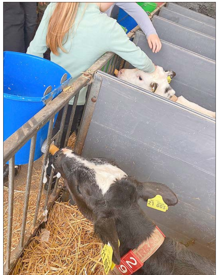
Fütterung der Kälbchen in Körner

Geduldig beantwortete er alle Fragen und ließ uns wissen, dass auch Kühe „Urlaub“ haben - 50 Tage im Jahr. Wir besuchten den Aufzuchtstall der Kälber mit seinen weiträumigen Boxen für viel Bewegungsfreiheit und mit computerunterstützten Kälbertränken.